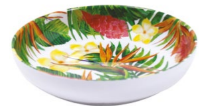
MF-16P : ASSIETTE CREUSE / SOUP-PASTA PLATE H : 4.5 cm / Ø 20 cm / 235 g