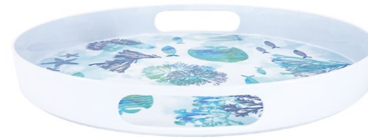
MC-24PP : GRAND PLATEAU ROND / LARGE ROUND TRAY

design intérieur / extérieur inside / outside design