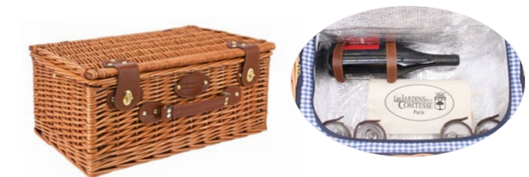
MARLY VICHY BLEU BLUE GINGHAM P-1915 - 46 x 31 x 23 cm - 4 pers