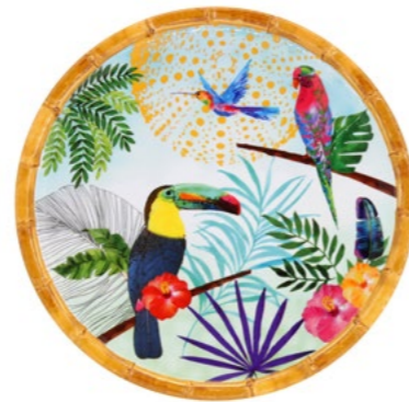
MTO-01AB : PETITE ASSIETTE / SMALL PLATE Ø 23 cm / 270 g