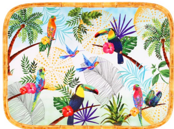
MTO-13MPB : PLATEAU RECTANGULAIRE / RECTANGULAR TRAY 45 x 32 cm / 630 g