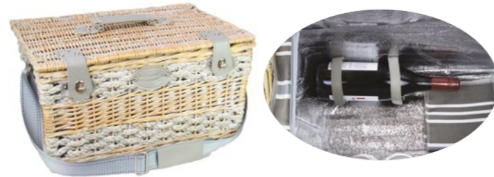
VERSAILLES P-1936 - 50 x 35 x 26 cm - 6 pers