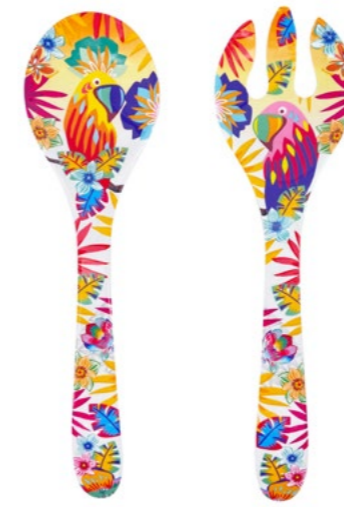
MPE-05C : COUVERTS À SALADE / SALAD SERVERS 33 cm / 155 g