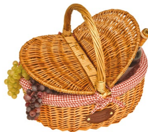
ROUGE / RED P-20003 - Set de 4 40 x 31 x 20/40 cm