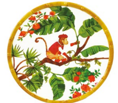
MJ-01AB : PETITE ASSIETTE / SMALL PLATE Ø 23 cm / 270 g