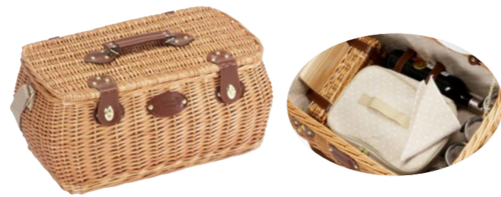
TROCADÉRO P-3000 - 50 x 33 x 25 cm - 4 pers