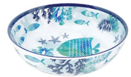
MC-23AC : ASSIETTE CREUSE / SOUP-PASTA PLATE H : 6 cm / Ø 19 cm / 215 g