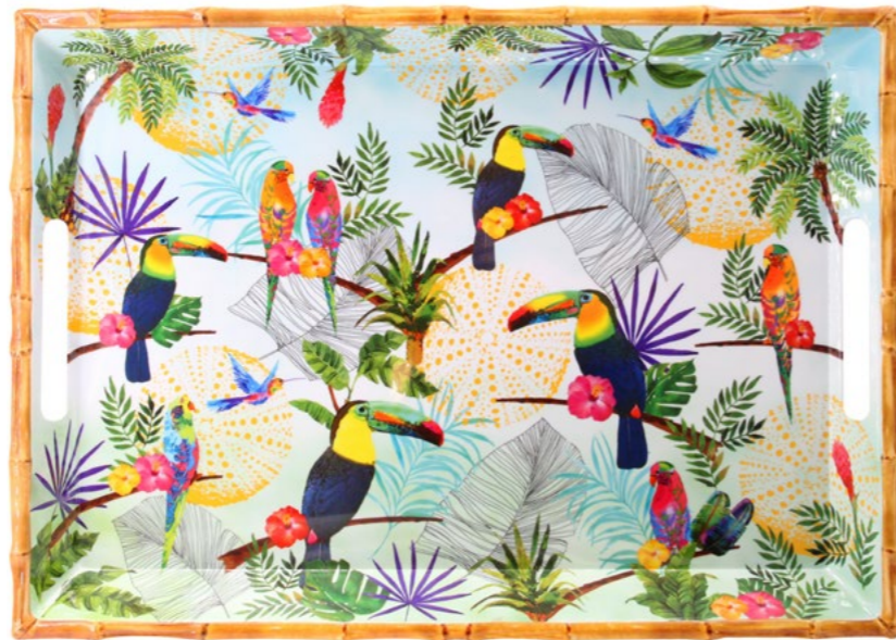
MTO-10GPB : GRAND PLATEAU / LARGE TRAY 50 x 36 x 5 cm / 950 g

Poignées renforcées / Extra thick handles