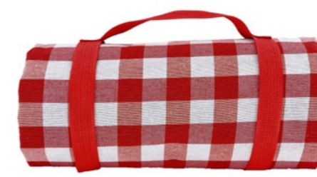
Nappe grands carreaux rouges Red checkered tablecloth

- NP18 : 140 x 140 cm - NP19-XL : 140 x 280 cm