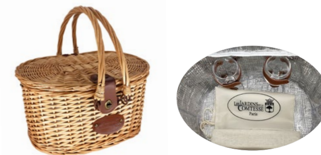
RIVOLI P-1952 - 48 x 43 x 33 cm - 2 pers