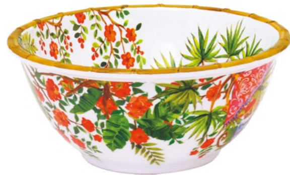
MJ-09SB : SALADIER PROFOND / DEEP SALAD BOWL H : 11 cm / Ø 25 cm / 3 L / 580 g

design intérieur / extérieur inside / outside design