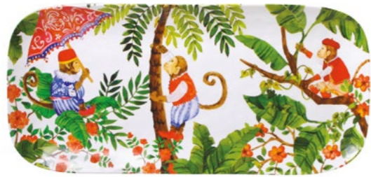
MJ-12PL : PLAT LONG / RECTANGULAR DISH 37.5 cm x 17 cm / 270 g