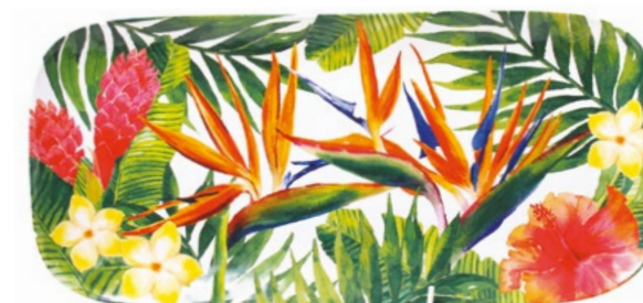
MF-12PL : PLAT LONG / RECTANGULAR DISH 37.5 x 17 cm / 270 g