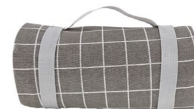
Nappe Concorde Concorde tablecloth

- NP50 : 140 x 140 cm - NP51-XL : 140 x 280 cm