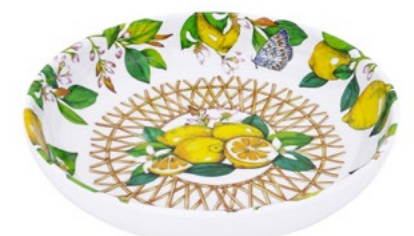
MCA-16P : ASSIETTE CREUSE / SOUP-PASTA PLATE H : 4.5 cm / Ø 20 cm / 235 g