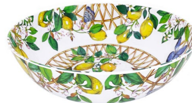
MCA-04S : GRAND SALADIER / LARGE SALAD BOWL H : 9.5 cm / Ø 31 cm / 4 L / 515 g