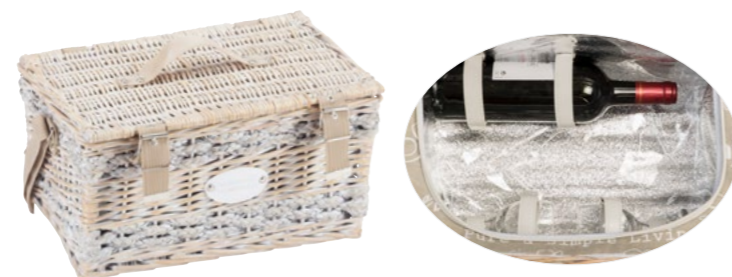
LOVE P-3004 - 43 x 30 x 23 cm - 2 pers