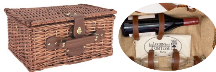
SAINT-MICHEL P-2037 - 38 x 28 x 18 cm - 2 pers