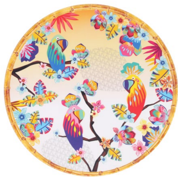
MPE-07PRB : PLAT ROND / ROUND DISH Ø 35.5 cm / 380 g