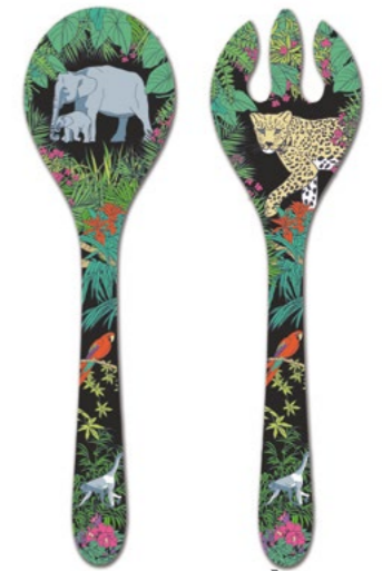
MJU-05C : COUVERTS À SALADE / SALAD SERVERS 33 cm / 155 g