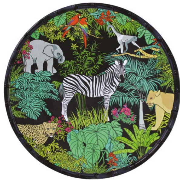
MJU-07PRB : PLAT ROND / ROUND DISH Ø 35.5 cm / 380 g