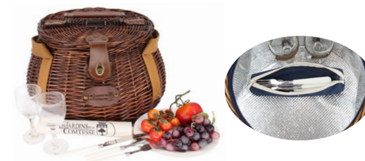
TUILERIES P-20008 - 40 x 40 x 25 cm - 2 pers