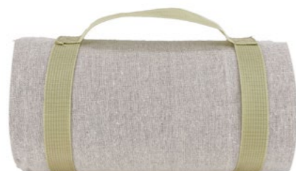
Nappe beige Beige tablecloth

- NP32 : 140 x 140 cm - NP33-XL : 140 x 280 cm