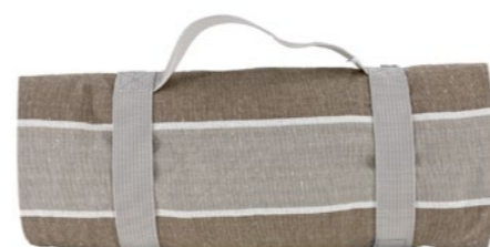
Nappe Polo-Club Polo-Club tablecloth

- NP2 : 140 x 140 cm - NP31-XL : 140 x 280 cm