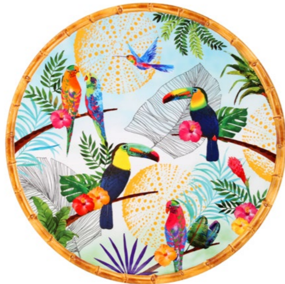
MTO-07PRB : PLAT ROND / ROUND DISH Ø 35.5 cm / 380 g