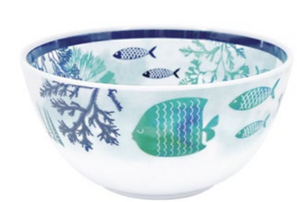
MC-25B : PETIT BOL / SMALL BOWL H : 8 cm / Ø 15 cm / 145 g