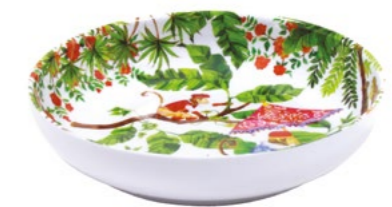
MJ-16P : ASSIETTE CREUSE / SOUP-PASTA PLATE H : 4.5 cm / Ø 20 cm / 235 g