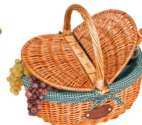
VERT / GREEN P-20021 - Set de 4 40 x 31 x 20/40 cm