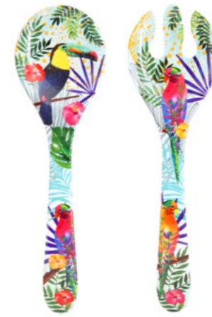
MTO-05C : COUVERTS À SALADE / SALAD SERVERS 33 cm / 155 g