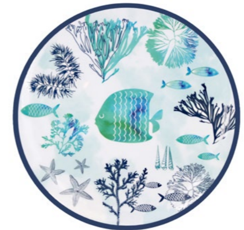
MC-21D : GRANDE ASSIETTE / LARGE PLATE Ø 27 cm / 180 g