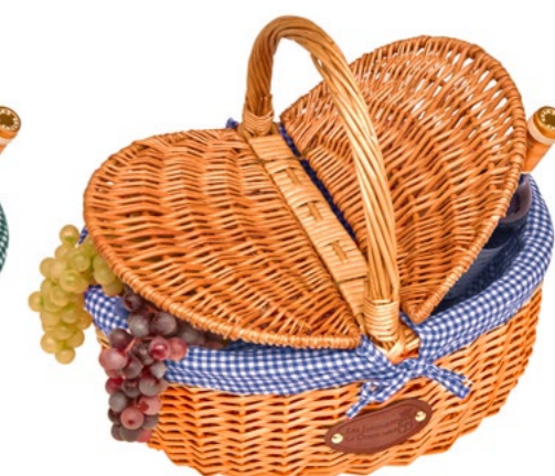
BLEU / BLUE P-20022 - Set de 4 40 x 31 x 20/40 cm