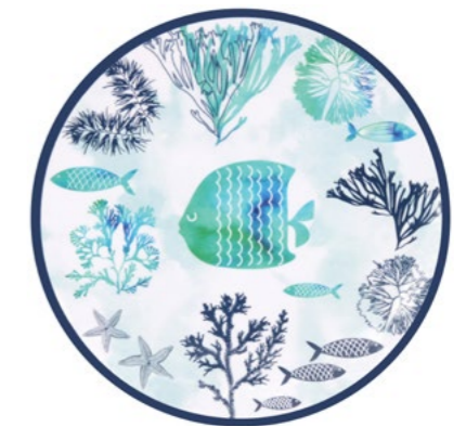
MC-20A : PETITE ASSIETTE / SMALL PLATE Ø 22 cm / 160 g