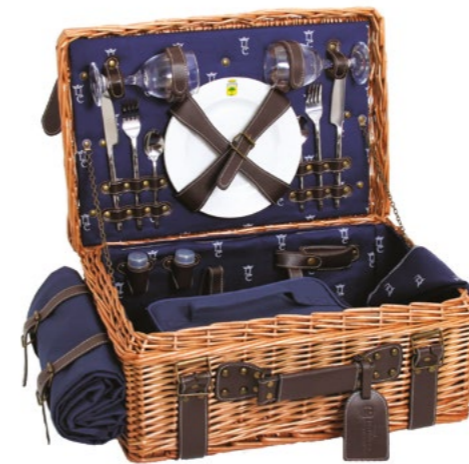
P-14124 - 48 x 34 x 21 cm - 2 pers.