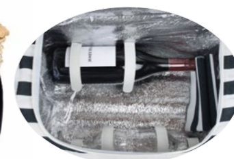
MARINE P-1929B - 43 x 30 x 23 cm - 2 pers