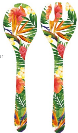
MF-05C : COUVERTS À SALADE / SALAD SERVERS 33 cm / 155 g