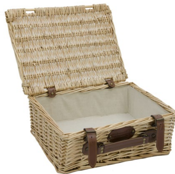
LIN P-15013 - Set de 4 39 x 29 x 15 cm