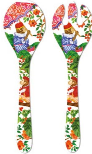
MJ-05C : COUVERTS À SALADE / SALAD SERVERS 33 cm / 155 g