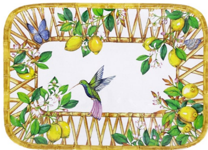
MCA-13MPB : PLATEAU RECTANGULAIRE / RECTANGULAR TRAY 45 x 32 cm / 630 g