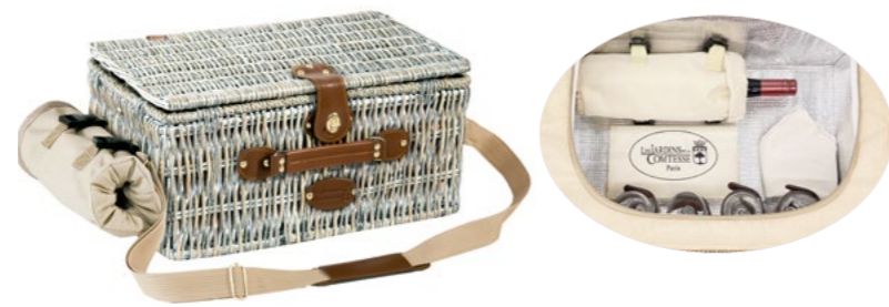
ANGERS P-2142 - 55 x 36 x 25 cm - 4 pers