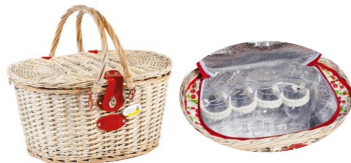
CHEVERNY P-1953 - 44 x 31 x 24 cm - 4 pers