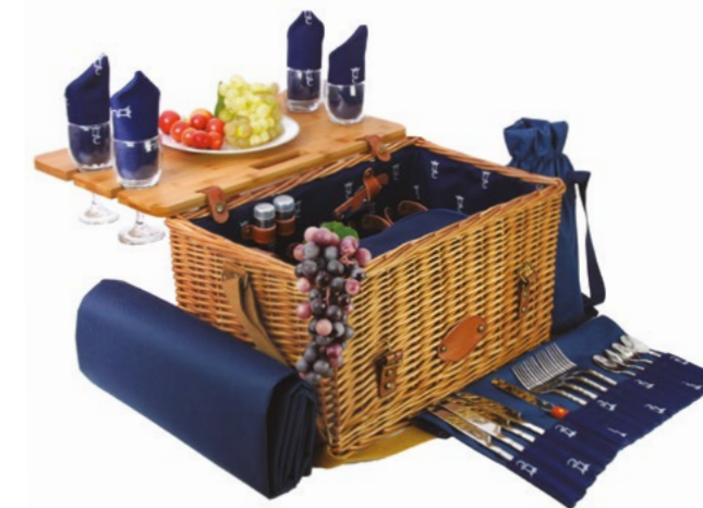
BLEU / BLUE P-15236 - 45 x 28 x 28 - 4 pers.