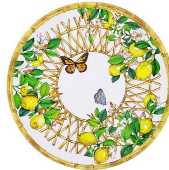
MCA-07PRB : PLAT ROND / ROUND DISH Ø 35.5 cm / 380 g