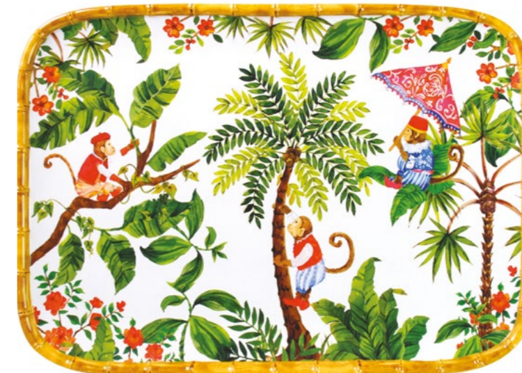
MJ-13MPB : PLATEAU RECTANGULAIRE / RECTANGULAR TRAY 45 x 32 cm / 630 g