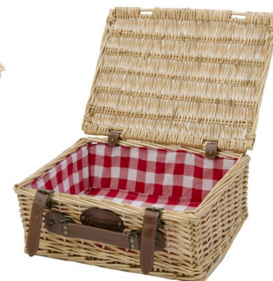
CARREAUX ROUGE P-15014 - Set de 4 39 x 29 x 15 cm