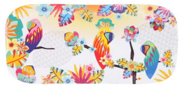
MPE-12PL : PLAT LONG / RECTANGULAR DISH 37.5 x 17 cm / 270 g