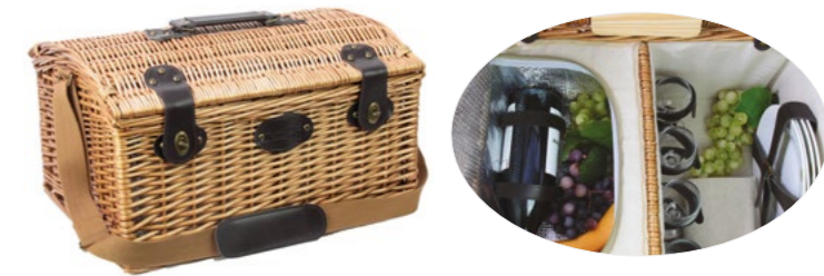
GISORS P-1940C - 48 x 36 x 27 cm - 4 pers