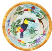
MTO-14BB : PETIT BOL / SMALL BOWL H : 7 cm / Ø 15 cm / 140 g