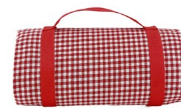
Nappe vichy rouge Red gingham tablecloth

- NP44 : 140 x 140 cm - NP45-XL : 140 x 280 cm