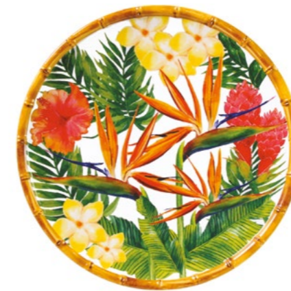
MF-02DB : GRANDE ASSIETTE / LARGE PLATE Ø 28 cm / 350 g