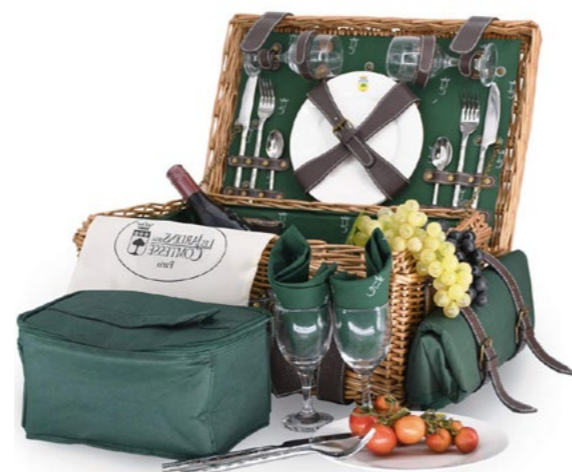
P-14118 - 48 x 34 x 21 cm - 2 pers.