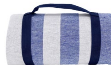
Nappe bleu ciel et blanc Sky blue and white tablecloth

- NP41 : 140 x 140 cm - NP42-XL : 140 x 280 cm