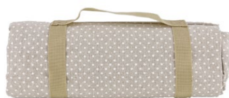
Nappe beige à pois blancs White dots beige tablecloth

- NP54 : 140 x 140 cm - NP55-XL : 140 x 280 cm