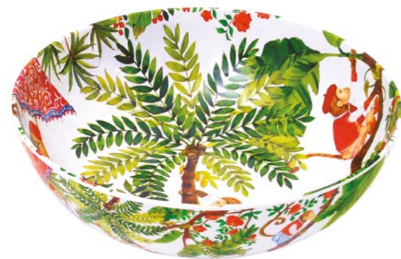
MJ-04S : GRAND SALADIER / LARGE SALAD BOWL H : 9.5 cm / Ø 31 cm / 4 L / 515 g

design intérieur / extérieur inside / outside design