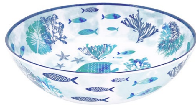
MC-04S : GRAND SALADIER / LARGE SALAD BOWL