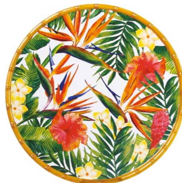
MF-07PRB : PLAT ROND / ROUND DISH Ø 35.5 cm / 380 g