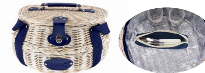
DEAUVILLE P-40008 - 41 x 41 x 25 cm - 2 pers