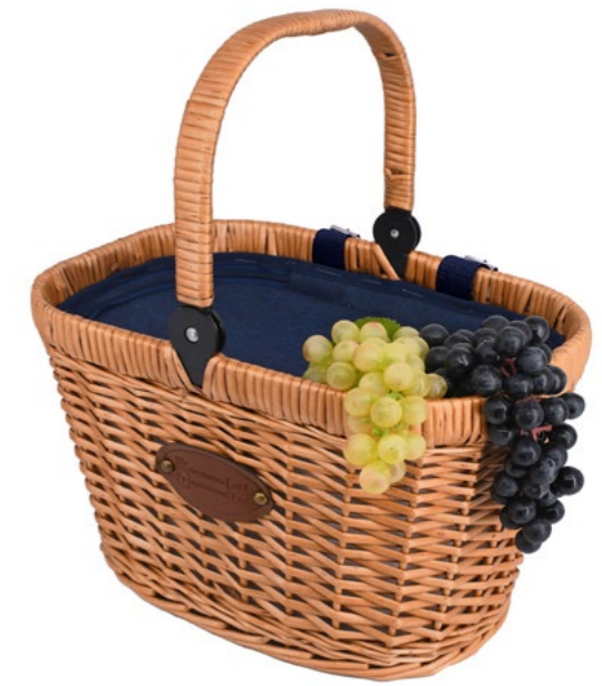
BLEU / BLUE P-2021 - Set de 4 37 x 27 x 23/43 cm