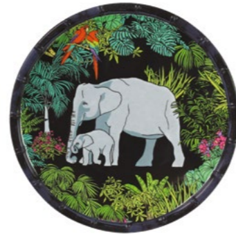
MJU-01AB : PETITE ASSIETTE / SMALL PLATE Ø 23 cm / 270 g