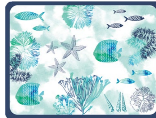
SET-MC : SET DE TABLE CARAÏBES CARIBBEAN PLACEMAT 40 x 30 cm