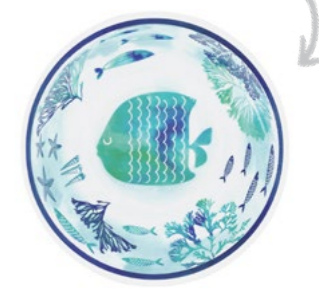
design intérieur / extérieur inside / outside design