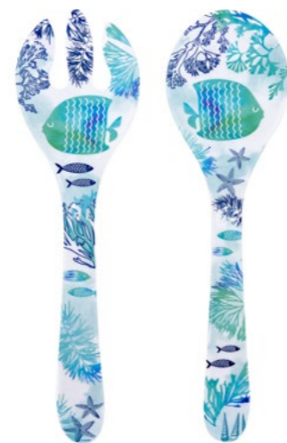
MC-05C : COUVERTS À SALADE / SALAD SERVERS