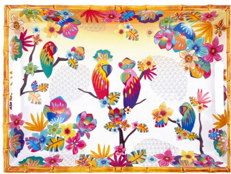
MPE-10GPB : GRAND PLATEAU / LARGE TRAY 50 x 36 x 5 cm / 950 g