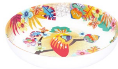
MPE-16P : ASSIETTE CREUSE / SOUP-PASTA PLATE H : 4.5 cm / Ø 20 cm / 235 g