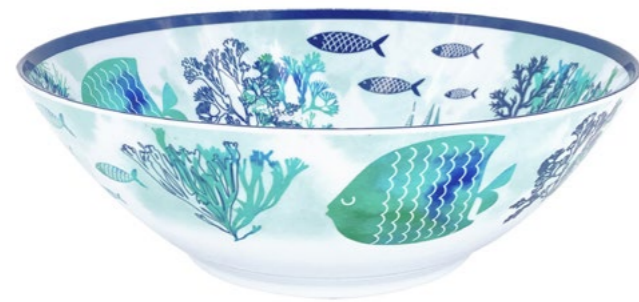
MC-22SM : PETIT SALADIER / SMALL SALAD BOWL