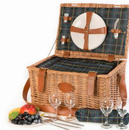
PH-002G - 45 x 31 x 24 cm - 4 pers.