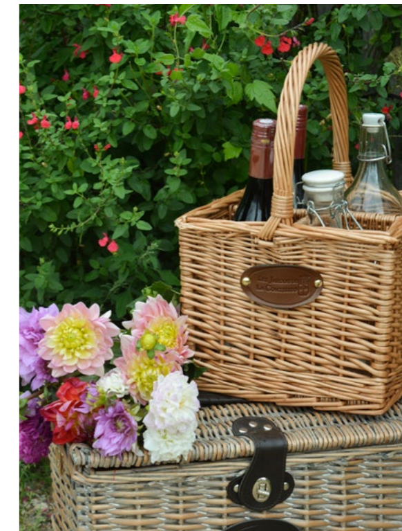
PB-002 - Set de 4 25 x 25 x 20/40 cm

Sommelier multi-fonctions / multi-function corkscrew