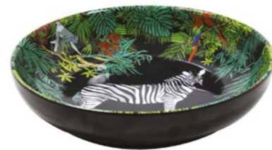
MJU-16P : ASSIETTE CREUSE / SOUP-PASTA PLATE H : 4.5 cm / Ø 20 cm / 235 g