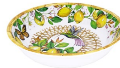
MCA-15SB : GRANDE ASSIETTE CREUSE / LARGE SOUP-PASTA PLATE H : 5.5 cm / Ø 23 cm / 230 g