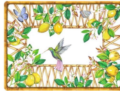
SET-MCA : SET DE TABLE CAPRI CAPRI PLACEMAT 40 x 30 cm