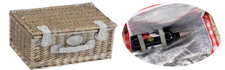
MARLY CARREAUX ROUGES RED CHECKERED P-1914 - 46 x 31 x 23 cm - 4 pers