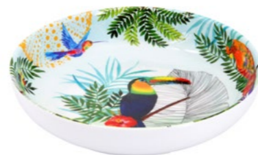
MTO-16P : ASSIETTE CREUSE / SOUP-PASTA PLATE H : 4.5 cm / Ø 20 cm / 235 g