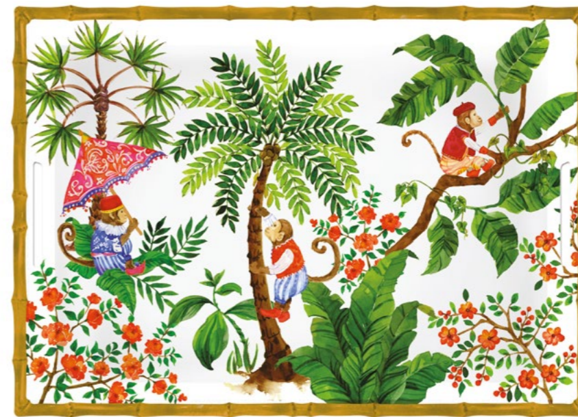
MJ-10GPB : GRAND PLATEAU / LARGE TRAY 50 x 36 x 5 cm / 950 g