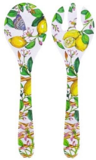
MCA-05C : COUVERTS À SALADE / SALAD SERVERS 33 cm / 155 g