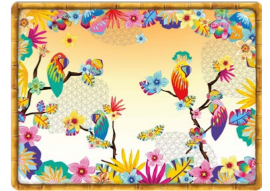
SET-MPE : SET DE TABLE PERROQUETS DE BAHIA PARROTS OF BAHIA PLACEMAT 40 x 30 cm