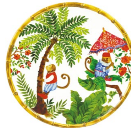
MJ-02DB : GRANDE ASSIETTE / LARGE PLATE Ø 28 cm / 350 g