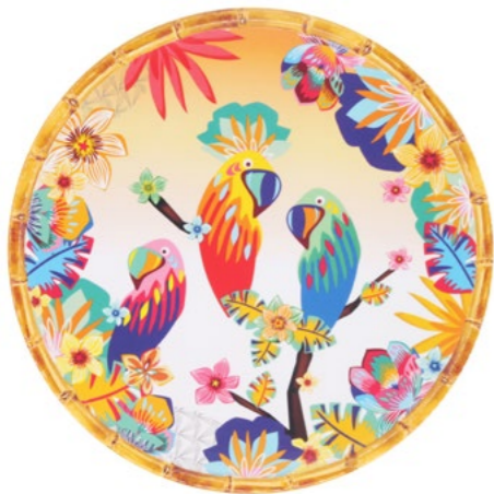
MPE-02DB : GRANDE ASSIETTE / LARGE PLATE Ø 28 cm / 350 g