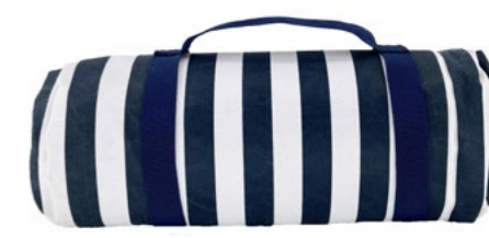
Nappe Marine Marine tablecloth

- NP39 : 140 x 140 cm - NP40-XL : 140 x 280 cm