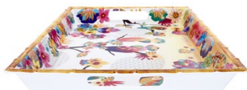
Poignées renforcées / Extra thick handles