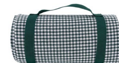
Nappe vichy vert foncé Dark green gingham tablecloth

- NP36 : 140 x 140 cm - NP37-XL : 140 x 280 cm