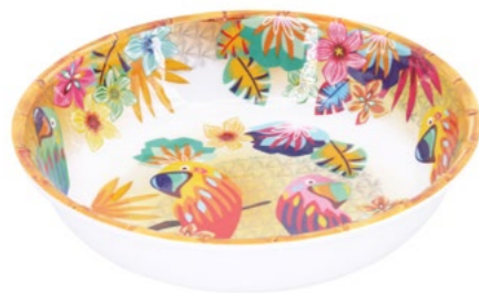
MPE-15SB : GRANDE ASSIETTE CREUSE / LARGE SOUP-PASTA PLATE H : 5.5 cm / Ø 23 cm / 230 g