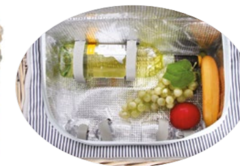
CHAUMONT P-1929 - 43 x 30 x 23 cm - 2 pers