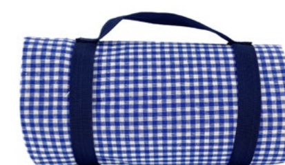
Nappe Vichy Bleu Blue gingham tablecloth

- NP16 : 140 x 140 cm - NP9-XL : 140 x 280 cm