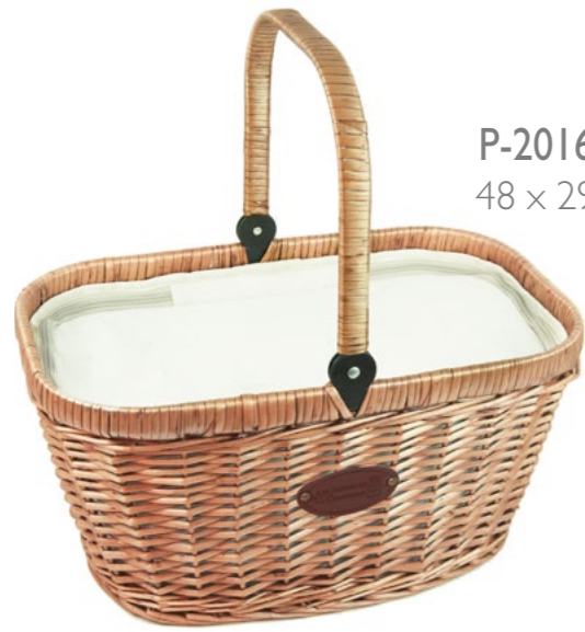
LIN P-2016 - Set de 4 48 x 29 x 27/50 cm