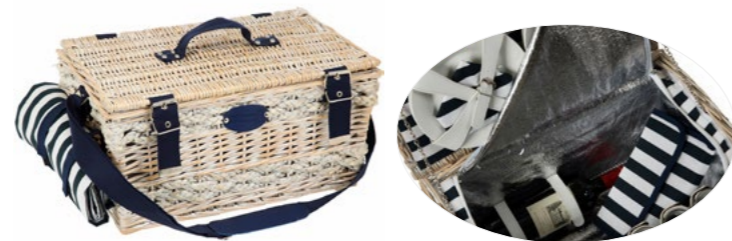
MARINE P-1936B - 50 x 35 x 26 cm - 6 pers