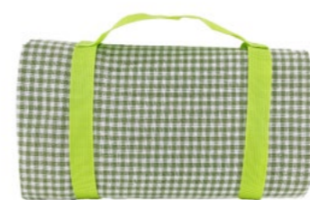
Nappe Vichy Vert Pomme Green apple gingham tablecloth

- NP5 : 140 x 140 cm - NP38-XL : 140 x 280 cm