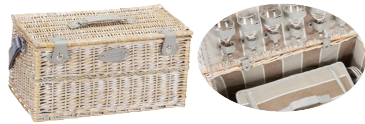
CHINON P-1376A - 53 x 31 x 30 cm - 6 pers