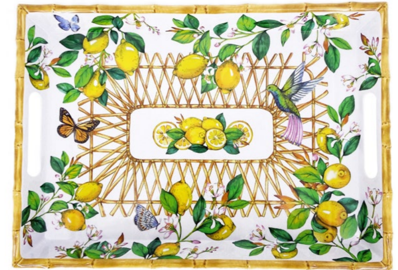
MCA-10GPB : GRAND PLATEAU / LARGE TRAY 50 x 36 x 5 cm / 950 g

Poignées renforcées / Extra thick handles