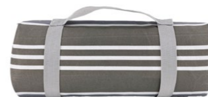
Nappe Versailles Versailles tablecloth

- NP14 : 140 x 140 cm - NP30-XL : 140 x 280 cm