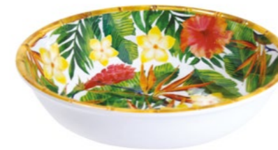
MF-15SB : GRANDE ASSIETTE CREUSE / LARGE SOUP-PASTA PLATE H : 5.5 cm / Ø 23 cm / 230 g