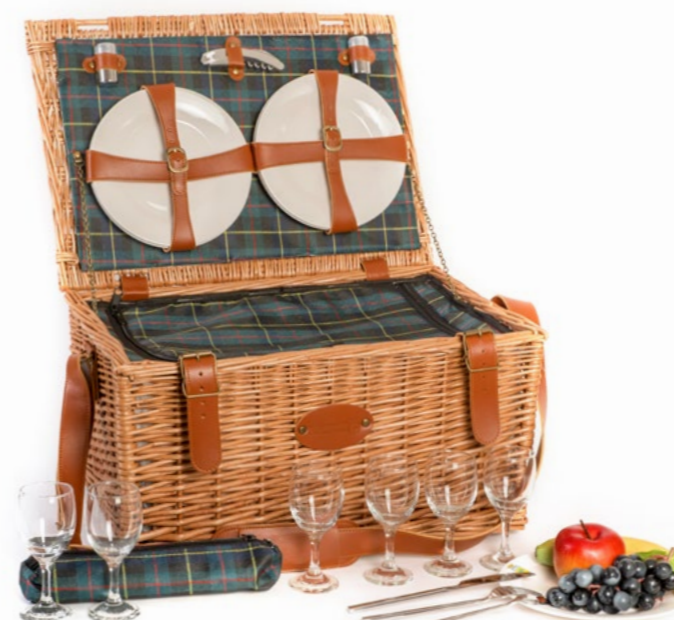
PH-003G - 50 x 36 x 27 cm - 6 pers.