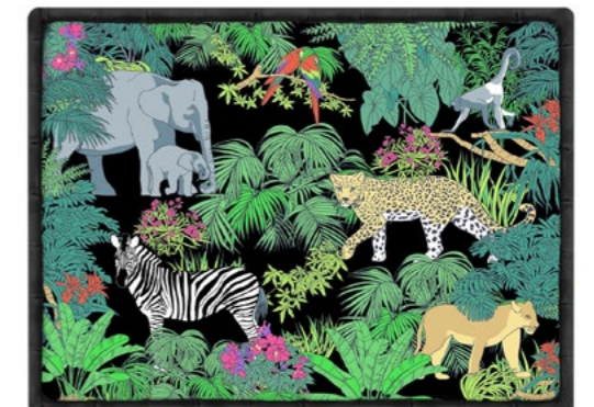
SET-MJU : SET DE TABLE JUNGLE JUNGLE PLACEMAT 40 x 30 cm