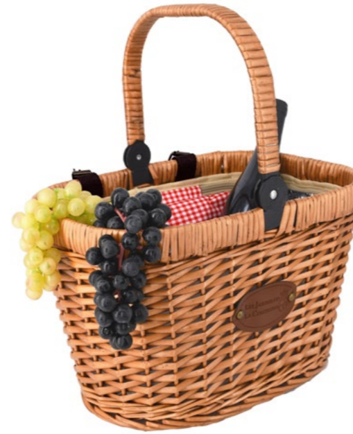
VICHY ROUGE / RED GINGHAM P-2020 - Set de 4 37 x 27 x 23/43 cm