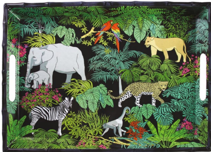
MJU-10GPB : GRAND PLATEAU / LARGE TRAY 50 x 36 x 5 cm / 950 g

Poignées renforcées / Extra thick handles