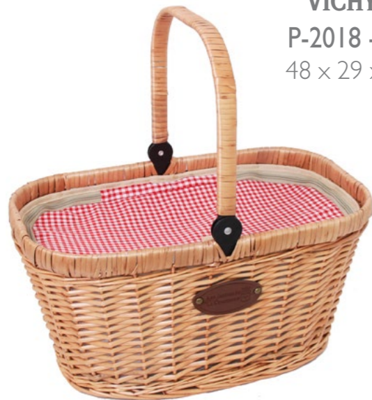
VICHY ROUGE P-2018 - Set de 4 48 x 29 x 27/50 cm