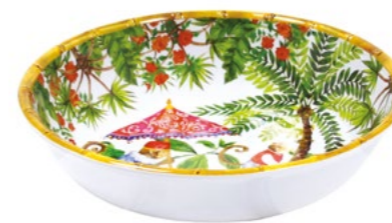
MJ-15SB : GRANDE ASSIETTE CREUSE / LARGE SOUP-PASTA PLATE H : 5.5 cm / Ø 23 cm / 230 g