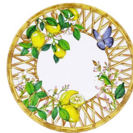
MCA-02DB : GRANDE ASSIETTE / LARGE PLATE Ø 28 cm / 350 g