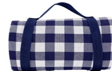
Nappe grands carreaux bleus Blue checkered tablecloth

- NP1 : 140 x 140 cm - NP11-XL : 140 x 280 cm