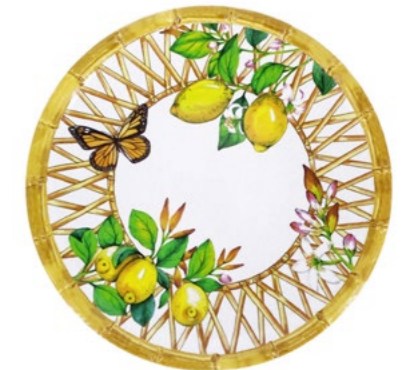
MCA-01AB : PETITE ASSIETTE / SMALL PLATE Ø 23 cm / 270 g