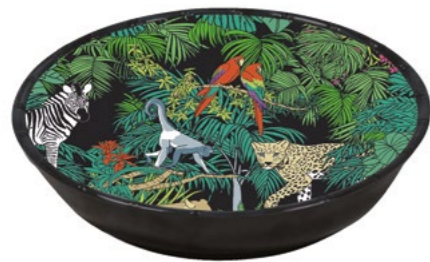
MJU-15SB : GRANDE ASSIETTE CREUSE / LARGE SOUP-PASTA PLATE H : 5.5 cm / Ø 23 cm / 230 g