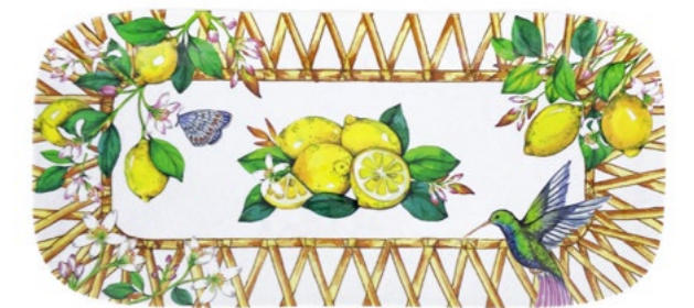
MCA-12PL : PLAT LONG / RECTANGULAR DISH 37.5 x 17 cm / 270 g