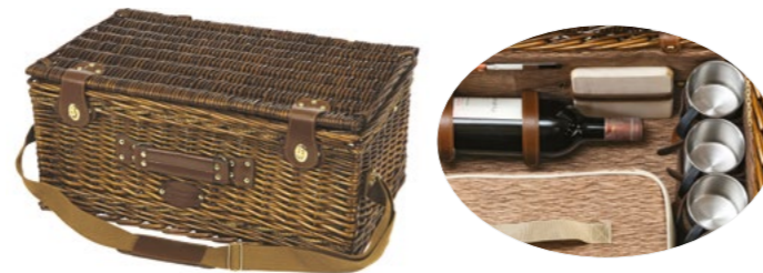
PALAIS ROYAL P-2732 - 56 x 36 x 24 cm - 4 pers