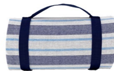
Nappe bleu et blanc à rayures Blue and white stripes tablecloth

- NP41 : 140 x 140 cm - NP42-XL : 140 x 280 cm