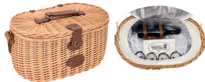
VENDÔME P-2295 - 47 x 31 x 23 cm - 4 pers