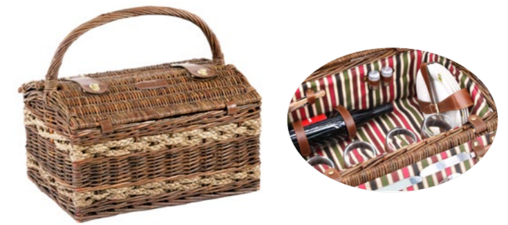
MONTMARTRE P-2905 - 46 x 30 x 27/45 cm - 4 pers