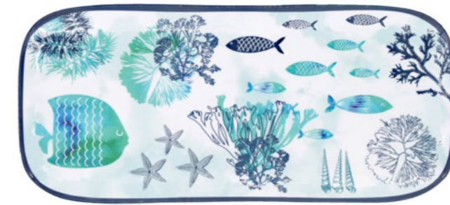
MC-12PL : PLAT LONG / RECTANGULAR DISH

design intérieur / extérieur inside / outside design