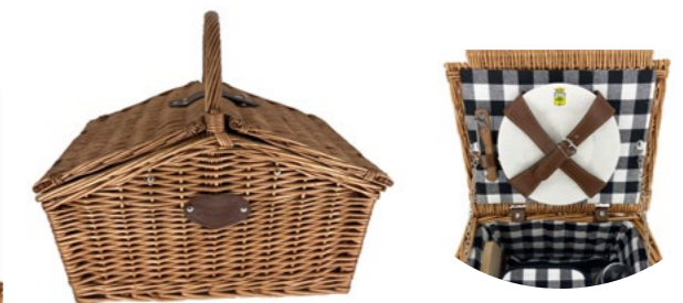
MONTAIGNE P-20000 - 47 x 30 x 30 cm - 4 pers