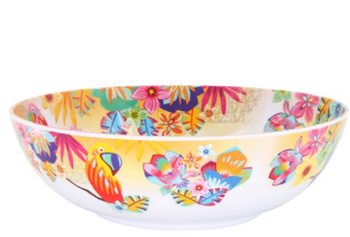
MPE-04S : GRAND SALADIER / LARGE SALAD BOWL H : 9.5 cm / Ø 31 cm / 4 L / 515 g