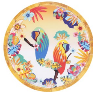
MPE-01AB : PETITE ASSIETTE / SMALL PLATE Ø 23 cm / 270 g