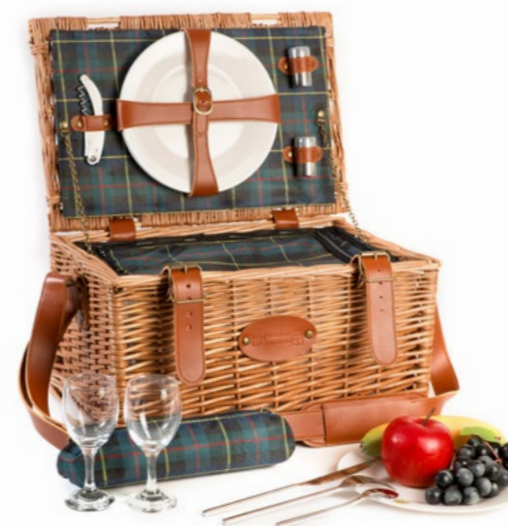
PH-001G - 40 x 30 x 23 cm - 2 pers.