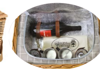
CONCORDE P-1960 - 42 x 30 x 23 cm - 2 pers