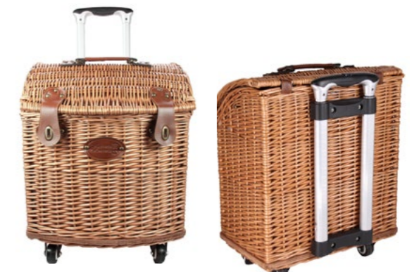
CONCORDE À ROULETTES PR-2742 - 41 x 35 x 50 cm - 4 pers