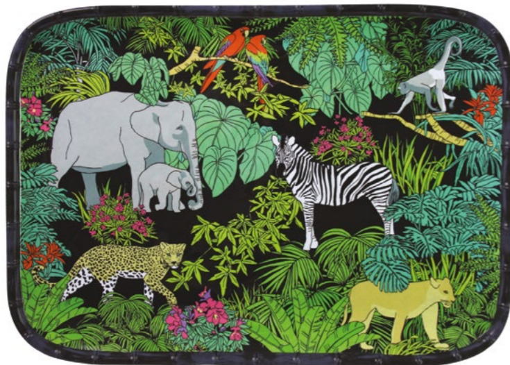
MJU-13MPB : PLATEAU RECTANGULAIRE / RECTANGULAR TRAY 45 x 32 cm / 630 g