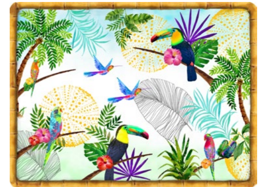
SET-MTO : SET DE TABLE TOUCANS DE RIO TOUCANS OF RIO PLACEMAT 40 x 30 cm