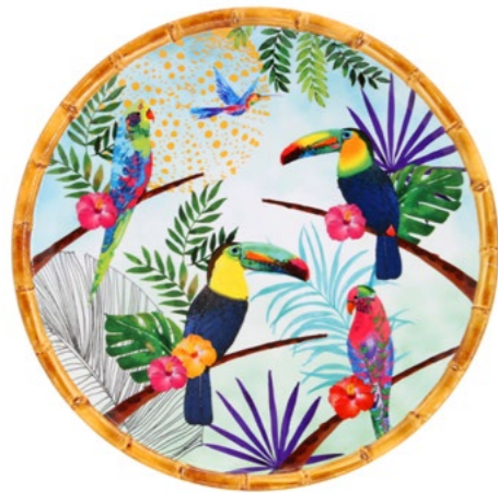
MTO-02DB : GRANDE ASSIETTE / LARGE PLATE Ø 28 cm / 350 g