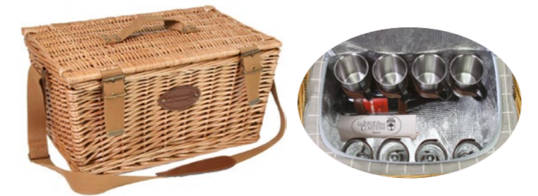
CONCORDE P-1961 - 47 x 31 x 24 cm - 4 pers