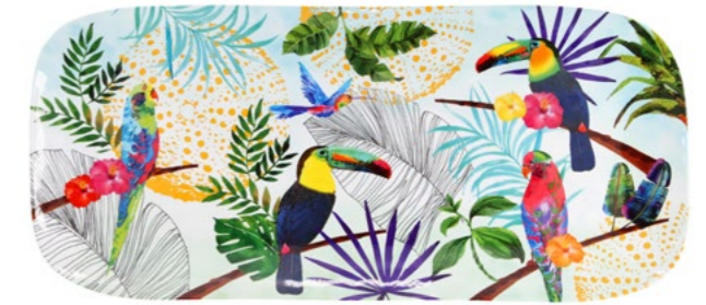
MTO-12PL : PLAT LONG / RECTANGULAR DISH 37.5 x 17 cm / 270 g