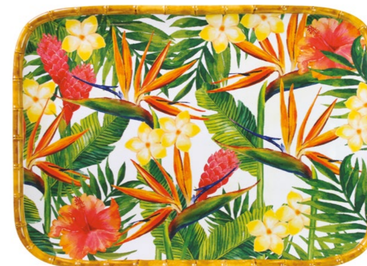
MF-13MPB : PLATEAU RECTANGULAIRE / RECTANGULAR TRAY 45 x 32 cm / 630 g