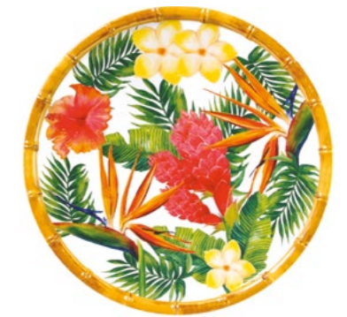
MF-01AB : PETITE ASSIETTE / SMALL PLATE Ø 23 cm / 270 g