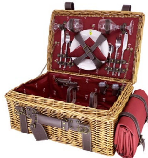
P-14127 - 48 x 34 x 21 cm - 2 pers.