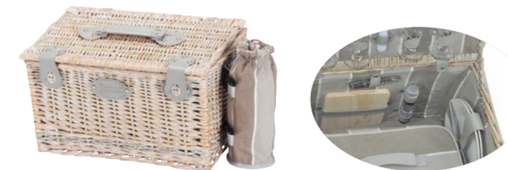
POLO CLUB P-2301 - 44 x 30 x 26 cm - 4 pers