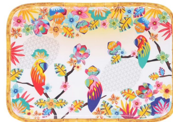
MPE-13MPB : PLATEAU RECTANGULAIRE / RECTANGULAR TRAY 45 x 32 cm / 630 g