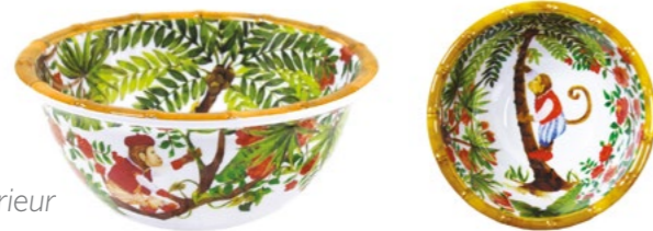
MJ-14BB : PETIT BOL / SMALL BOWL H : 7 cm / Ø 15 cm / 140 g

design intérieur / extérieur inside / outside design