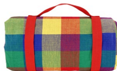
Nappe multicolore Multicolor tablecloth

- NP20 : 140 x 140 cm - NP20-XL : 140 x 280 cm