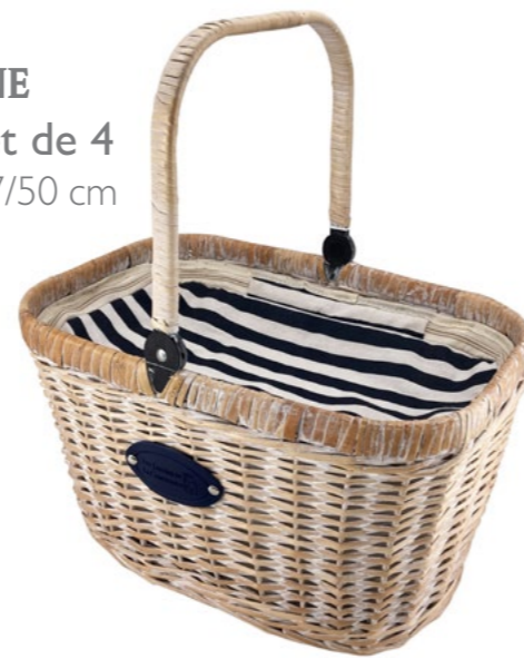
MARINE P-2017 - Set de 4 48 x 29 x 27/50 cm