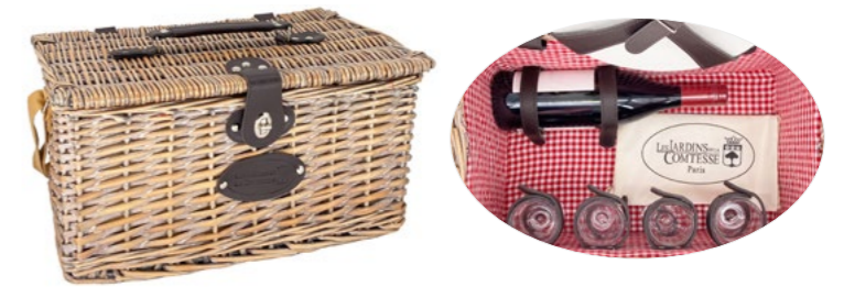
SULLY P-1639E - 43 x 29 x 21 cm - 4 pers