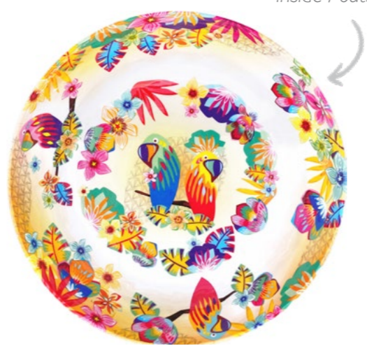
design intérieur / extérieur inside / outside design