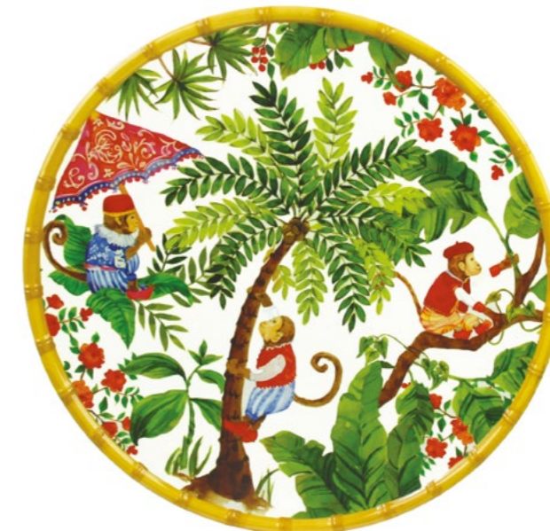
MJ-07PRB : PLAT ROND / ROUND DISH Ø 35.5 cm / 380 g

design intérieur / extérieur inside / outside design