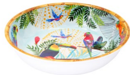
MTO-15SB : GRANDE ASSIETTE CREUSE / LARGE SOUP-PASTA PLATE H : 5.5 cm / Ø 23 cm / 230 g