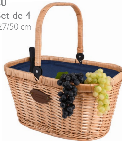
BLEU P-2019 - Set de 4 48 x 29 x 27/50 cm