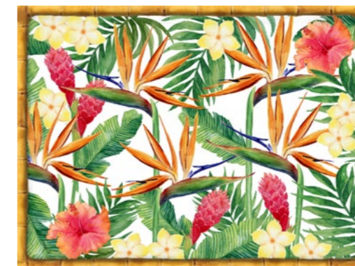
SET-FL : SET DE TABLE FLEURS EXOTIQUES EXOTIC FLOWERS PLACEMAT 40 x 30 cm