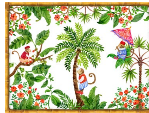
SET-BA : SET DE TABLE SINGES DE BALI MONKEYS OF BALI PLACEMAT 40 x 30 cm