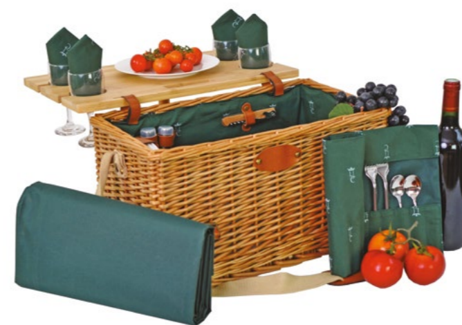
VERT / GREEN P-15235 - 45 x 28 x 28 - 4 pers.