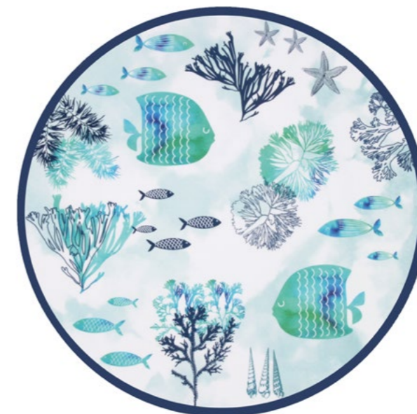
MC-07PRB : PLAT ROND / ROUND DISH