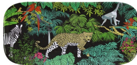
MJU-12PL : PLAT LONG / RECTANGULAR DISH 37.5 x 17 cm / 270 g