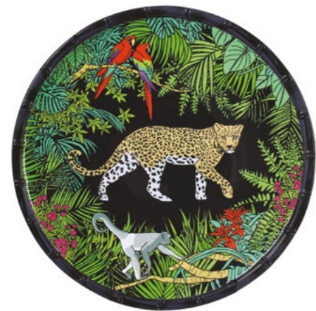
MJU-02DB : GRANDE ASSIETTE / LARGE PLATE Ø 28 cm / 350 g