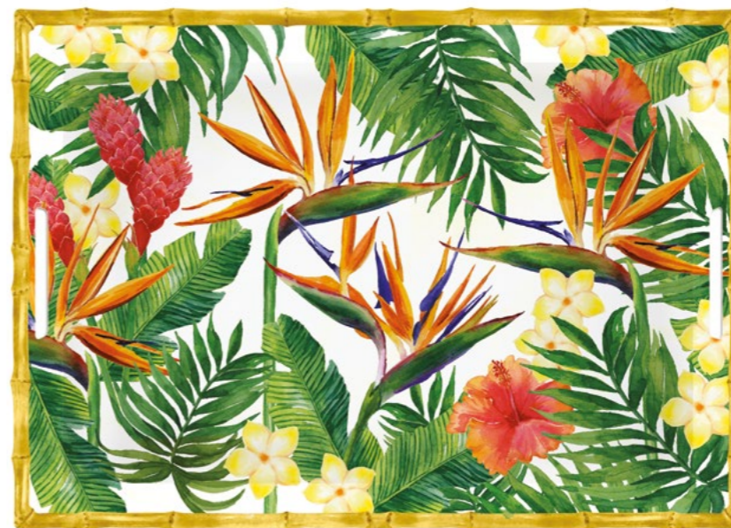
MF-10GPB : GRAND PLATEAU / LARGE TRAY 50 x 36 x 5 cm / 950 g