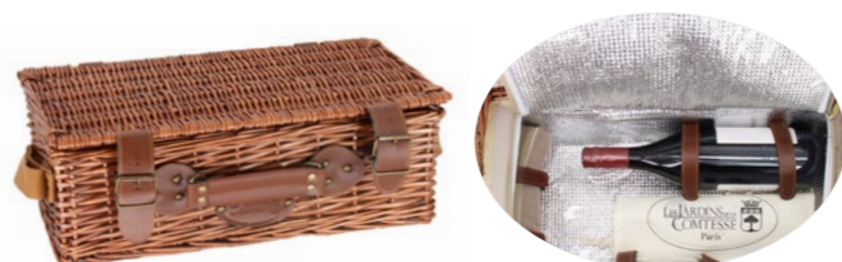
AMBOISE P-2039 - 46 x 26 x 18 cm - 2 pers