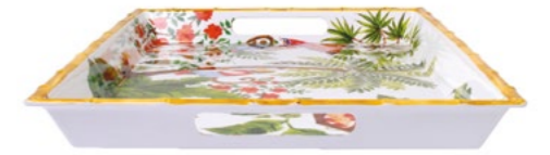
Poignées renforcées / Extra thick handles