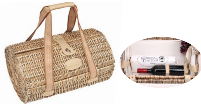
OPÉRA P-20004 - 47 x 30 x 30 cm - 4 pers